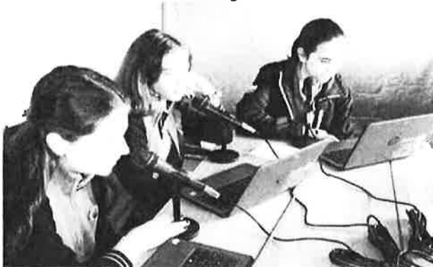
Publicación en RRSS da inauguración da Radio PonteLila.

calasanciopontevedra • Seguir calasanciopontevedra Ya esta disponible el nuevo programa de radio de PonteLila (nuestro equipo de igualdad) en la web de nuestro colegio. #calasanciopontevedra #equiodeligualdad #pontelila 51 Me gusta