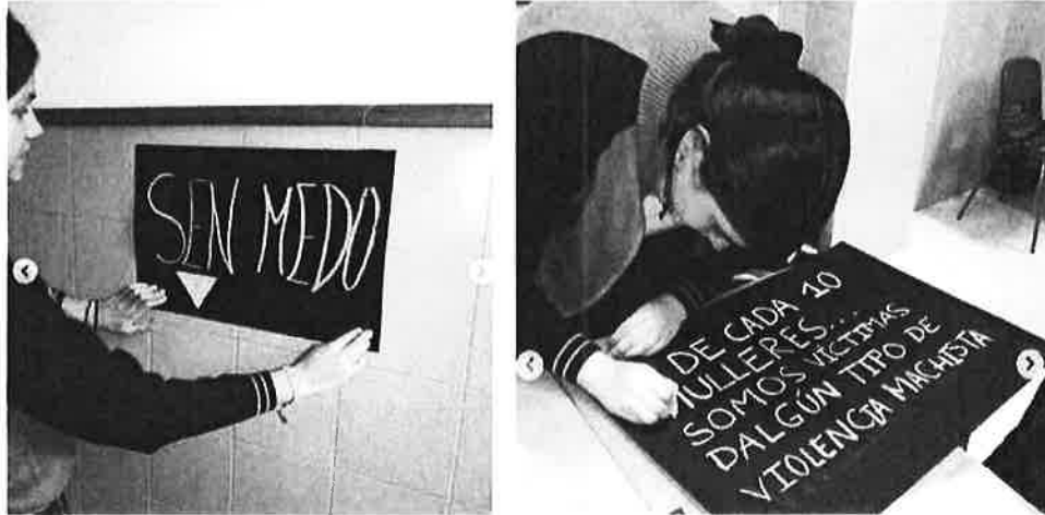
Preparación da actividades "Calasancio en Negro contra a violencia machista"