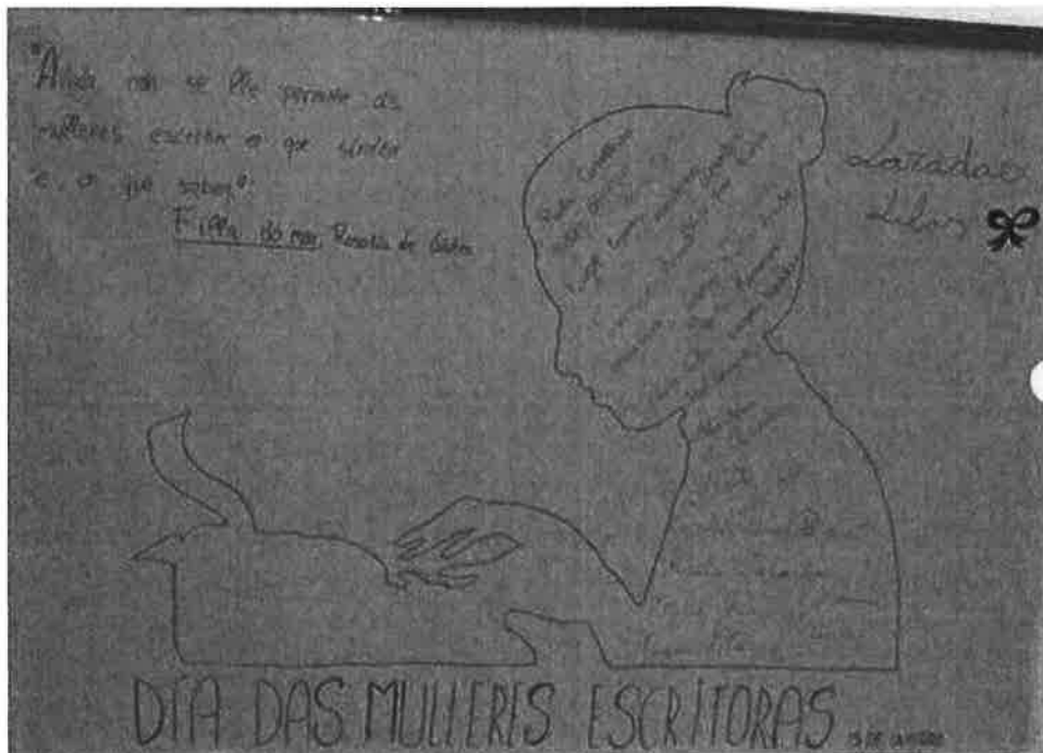
Mural para celebrar o Día das Mulleres Escritoras