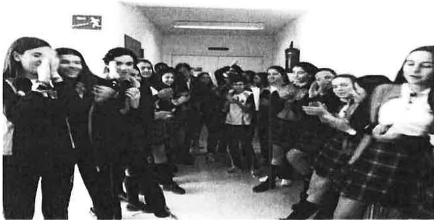
As Lazadas Lilas expectantes coa inauguración da Radio PonteLila