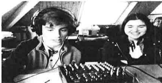
Instantes da gravación do primeiro programa