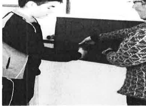
Momentos da inauguración.